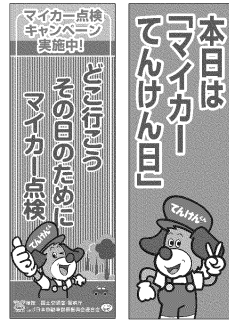
1 のぼり旗 (キャンペーン用) 2 のぼり旗 (マイカーでてんけん日用)