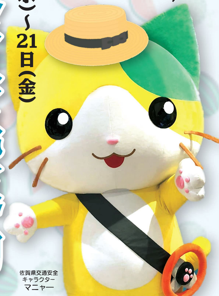
佐賀県交通安全 キャラクター マニャー