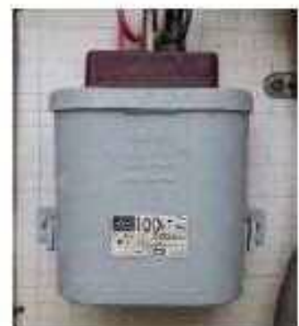
小型コンデンサー