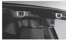
複眼カメラ